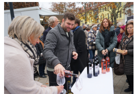
Gut besucht war die Martiniveranstaltung, bei der auch gleich der neue Stadtwein präsentiert wurde.

Im Jahr 2025 stehen in Mattersburg auch abgesehen von den Veranstaltungen viele Projekte auf der Agenda. Ein Schwerpunkt heuer ist die Fortführung der Innenstadtgestaltung. Der Fokus liegt nun auf der Judengasse, dem Brunnenplatz und Teilen der Gustav Degen-Gasse. Ziel ist es, das Stadtzentrum weiter zu modernisieren. Auch der Spielplatz in Walbersdorf soll heuer saniert werden. Unter Einbindung von Vorschlägen aus der Bevölkerung wird ein attraktiver, familienfreundlicher Ort entstehen.