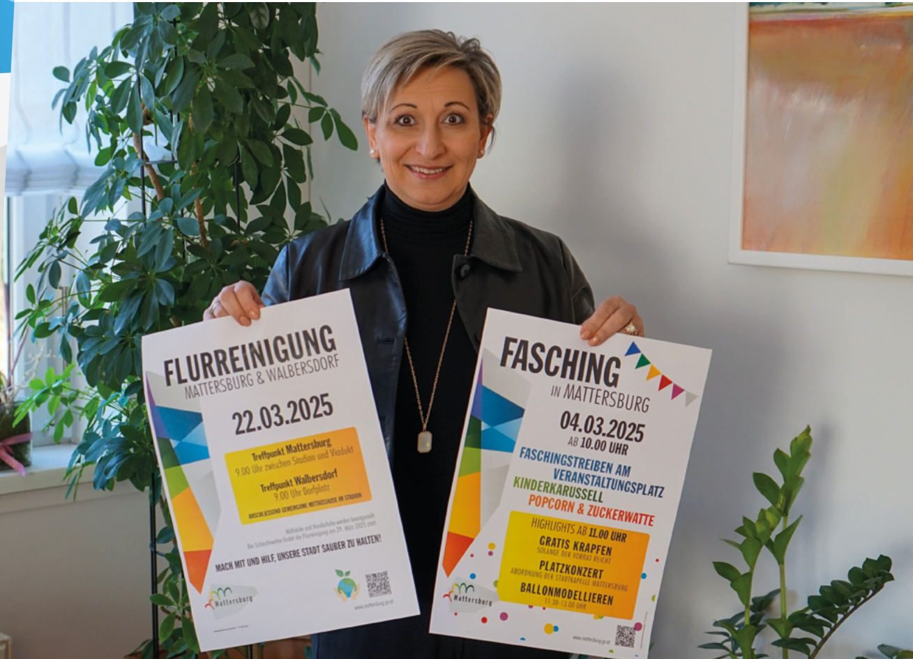
Vorfremde auf die bevorstehenden Veranstaltungen der Stadtgemeinde Mattersburg: Das Faschingsstreiben am Faschingsdienstag sowie die alljährliche Flurreinigung in Mattersburg und Walbersdorf stehen bevor!