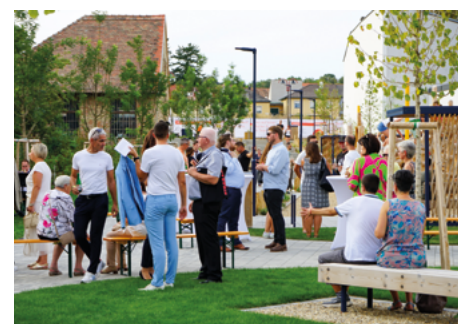
Die Eröffnung des Jubiläumsparks war eines der Highlights im vergangenen Jahr 2024.