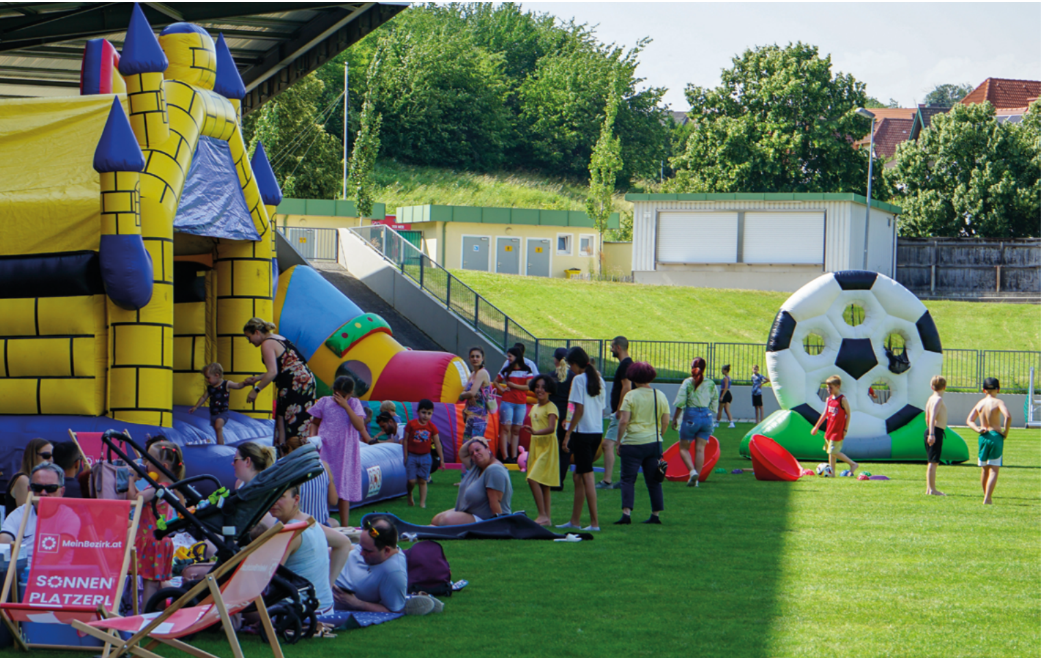
Letztes Jahr durfte das Stadionpicknick viele kleine und große Besucher:innen begrüßen - auch dieses Jahr ist es wieder ein Höhepunkt im Veranstaltungskalender der Stadt!

Martiniveranstaltung für traditionelle Stimmung, bevor der Weihnachtsmarkt an verschiedenen Standorten das Jahr besinnlich ausklingen ließ. Im Jahr 2024 wurde erstmals das Stadtkulinarium veranstaltet. Aufgrund der schlechten Resonanz und des großen finanziellen sowie personellen Aufwands wird es in diesem Jahr nicht mehr stattfinden.